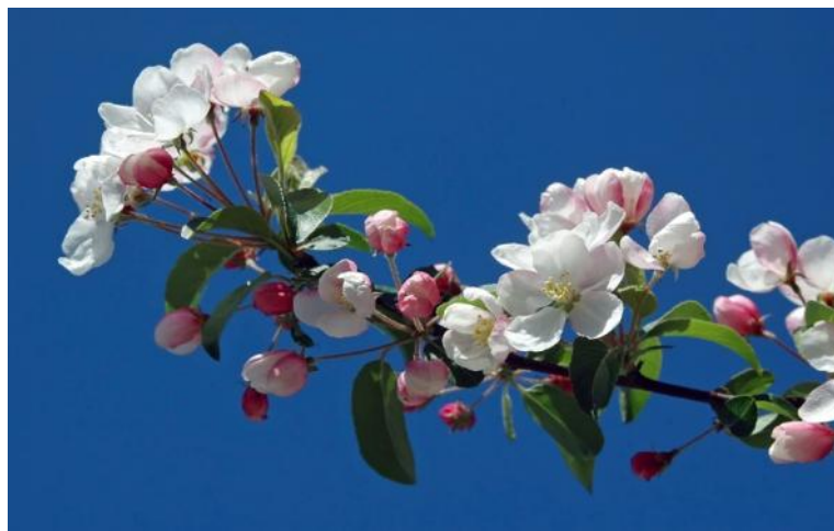
"Æbletræet i blomst"