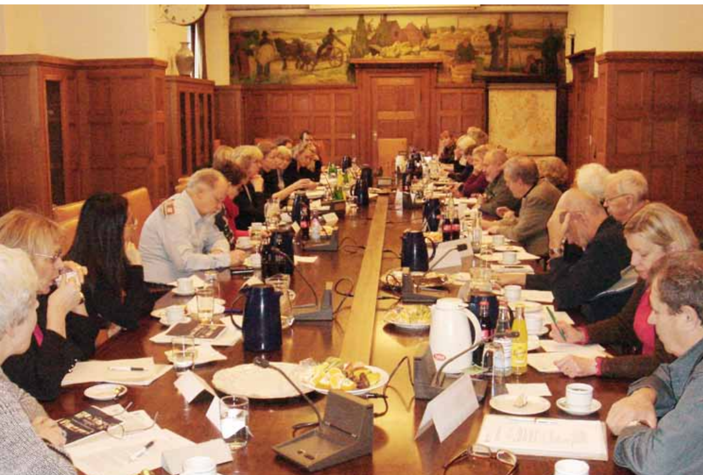
Formandsgruppens møde med Sundheds- og Omsorgsudvalget på Rådhuset den 15. dec. 2011.