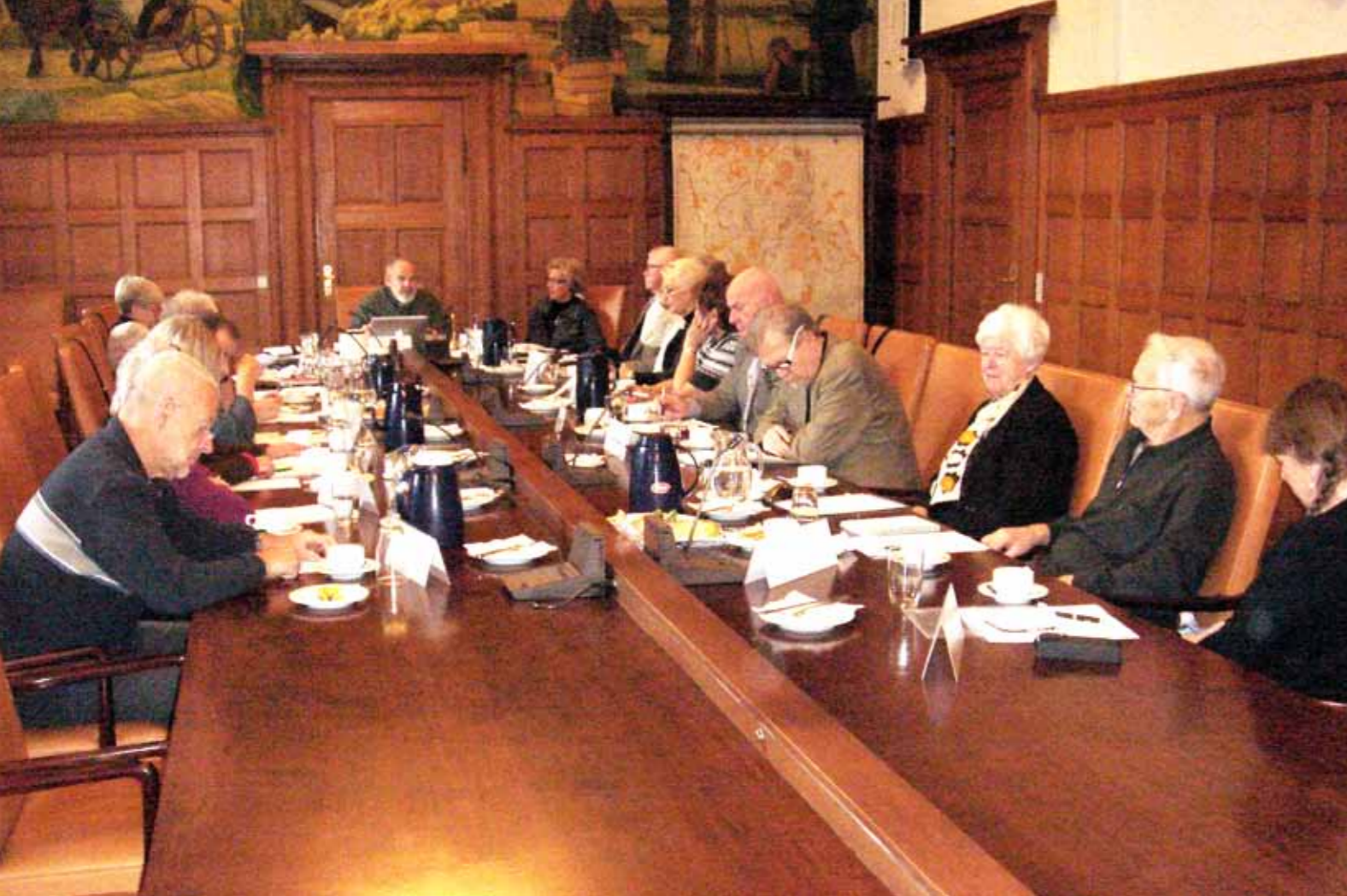
Det afsluttende årsmøde i Formandsgruppen den 15. december 2011 på Rådhuset.