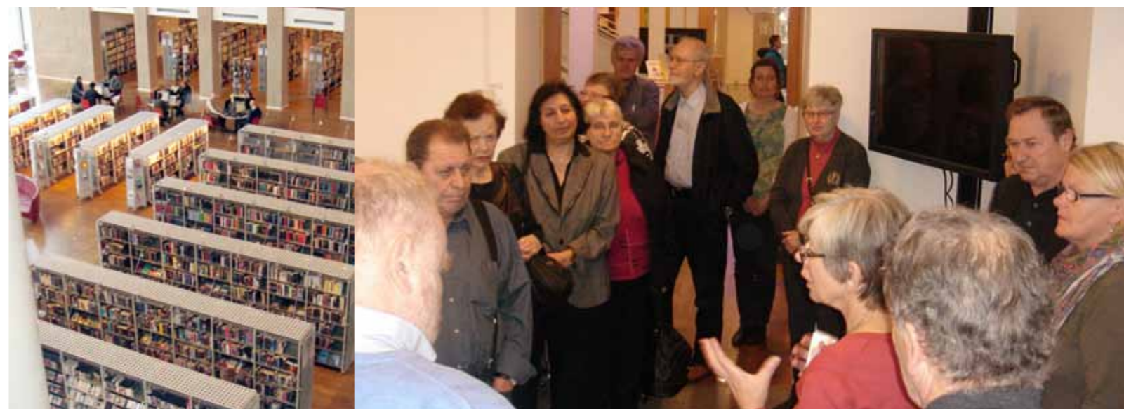
Det halvårige møde med Den Centrala Pensionärsorganisation i Malmö den 14. november 2011 på Stadsbiblioteket i Malmö.

Mødet den 14. november 2011 fandt sted på Malmö's meget flotte hovedbibliotek, hvor den nye del er tegnet af arkitekt Henning Larsen. Emnerne var: