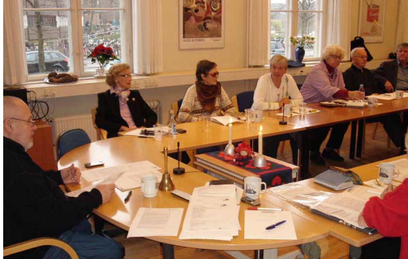
Møde i Regionsudvalget i ældrerådernes mødelokale den 24. november 2011.

Der kan herudover fremsættes forslag på møderne i Formandsgruppen om nedsættelse af yderligere udvalg. Et ældreråd kan udpege højst ét medlem til hvert udvalg.