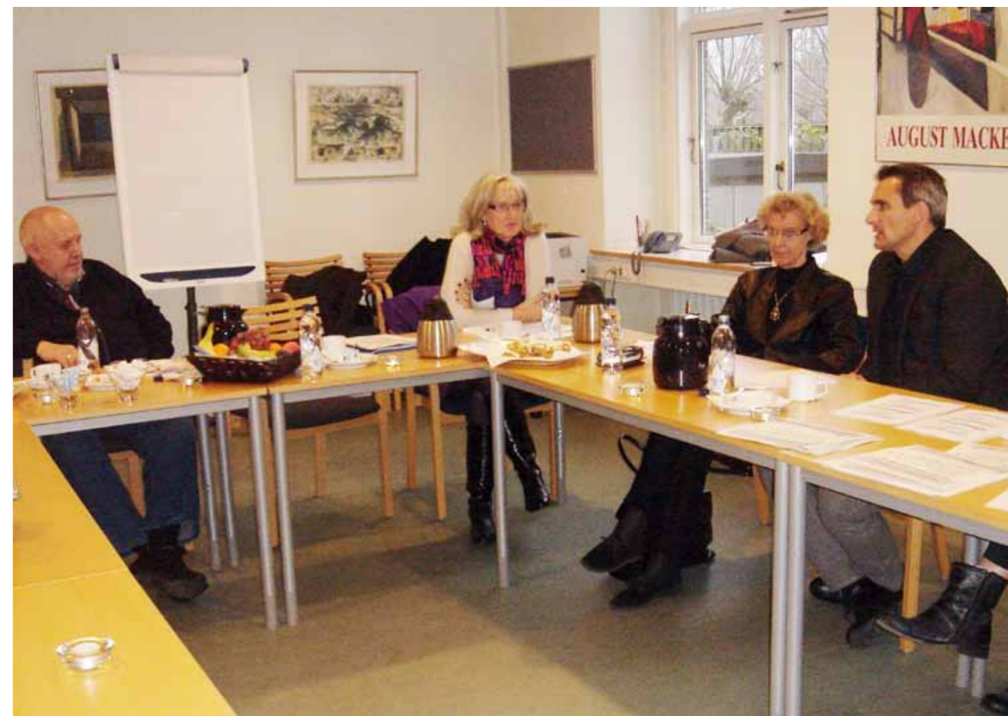
Forretningsudvalgets møde med Borgerservice den 23. november 2011.