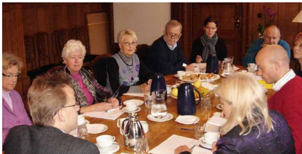
Forretningsudvalget til møde med Socialborgmester Mikkel Warming den 22. november 2011.