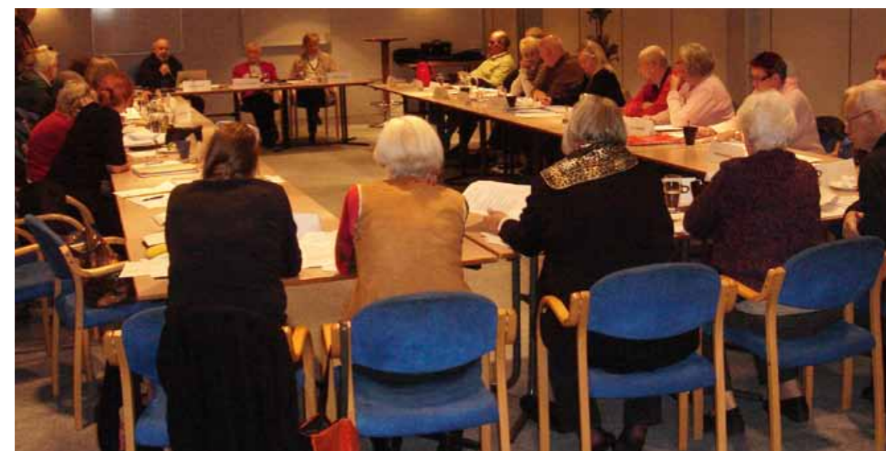
Fra Formandsgruppens seminar på hotel Frederik d. II i Slagelse den 17. og 18. november 2011.