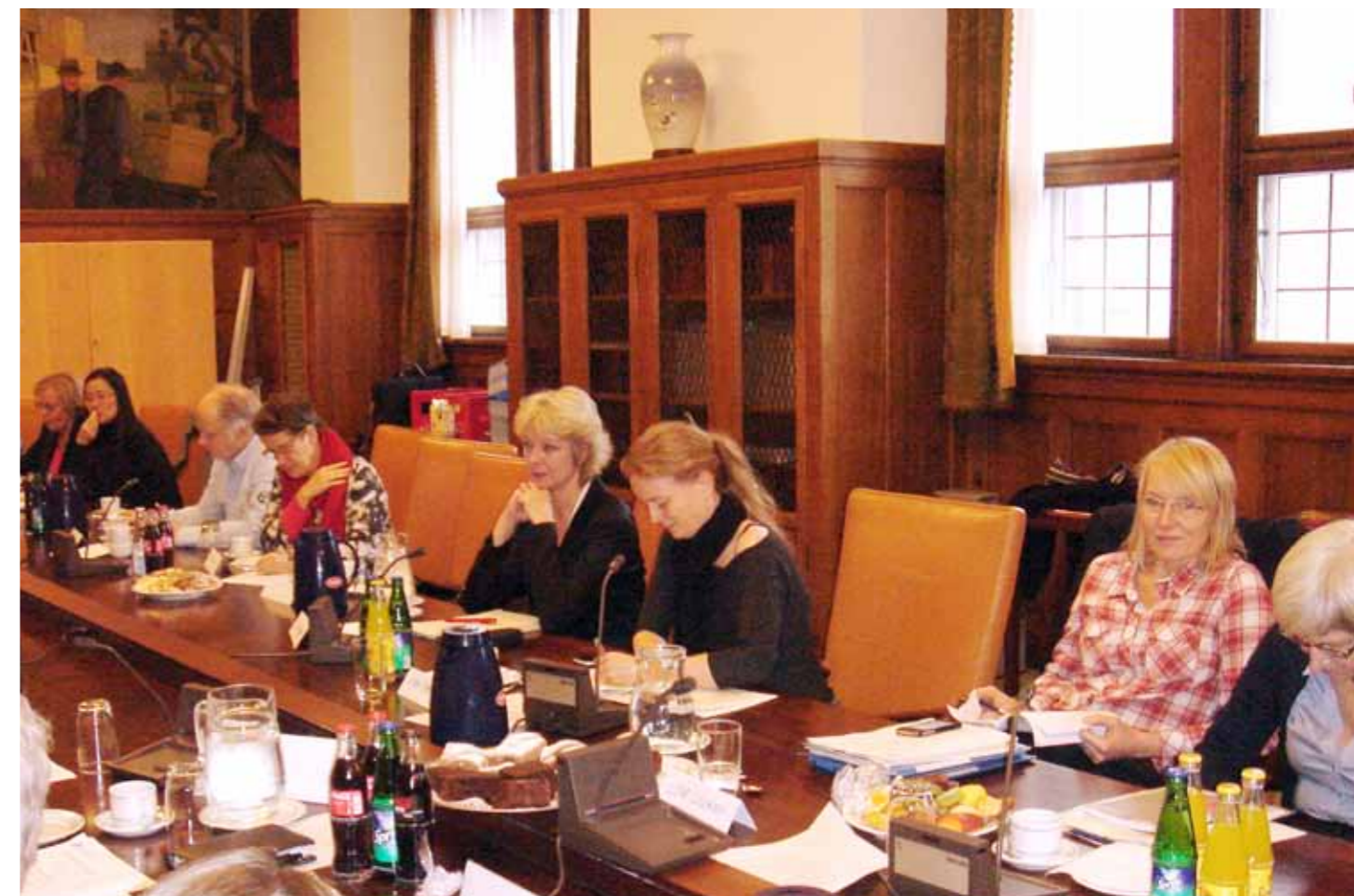
Formandsgruppens møde med Sundheds- og Omsorgsudvalget 15. dec. 2011.