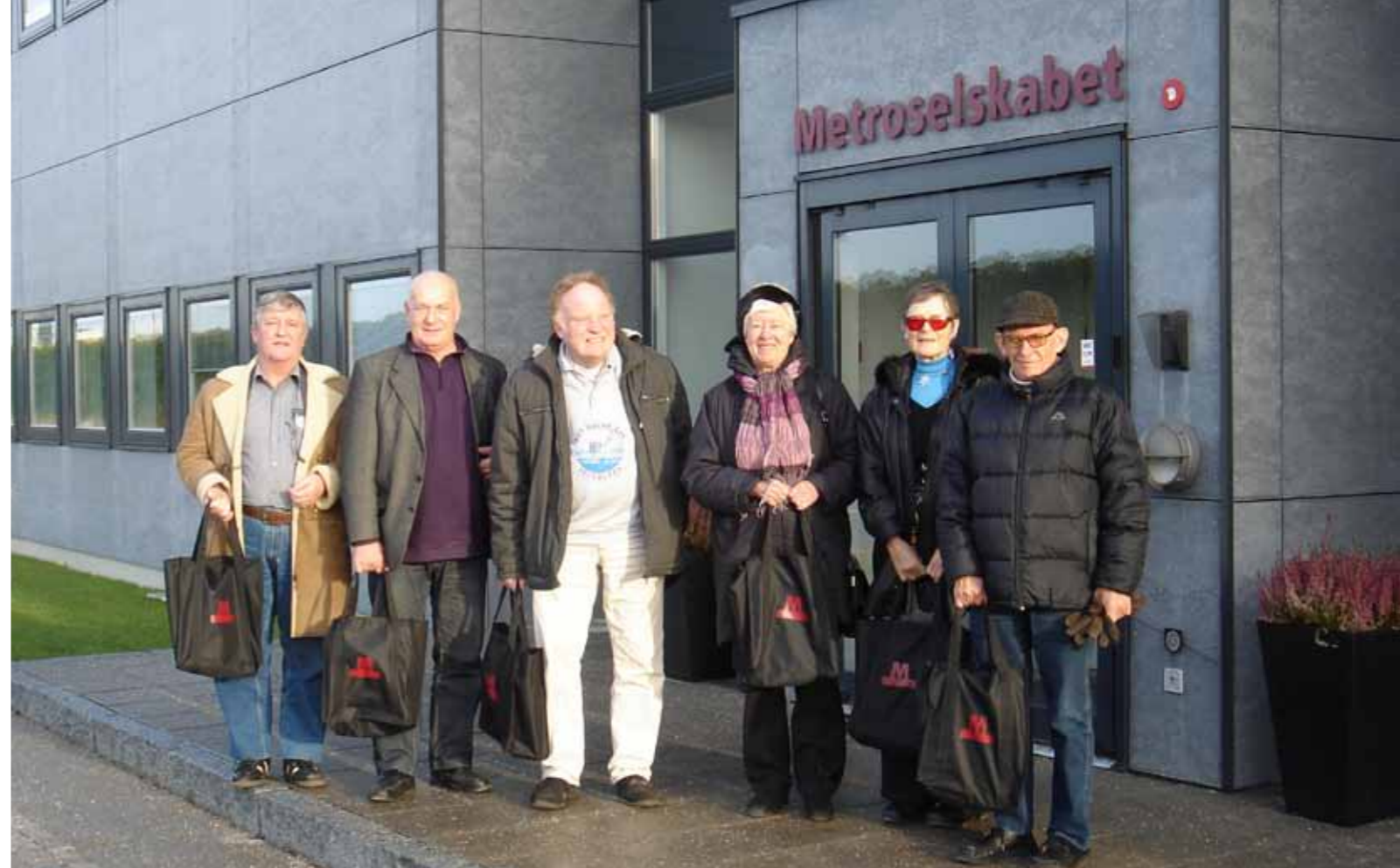
Møde med Metroselskabet den 8. december 2011.

Mange forskellige forhold af trafikal art, i særdeleshed vedr. tilgængelighed i bred forstand, har været berørt i udvalget, der som en af de store sager i året har haft udarbejdelse af et høringssvar i sagen om en fodgængerstrategi for København.