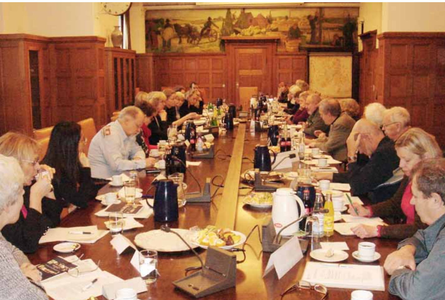
Formandsgruppens møde med Sundheds- og Omsorgsudvalget på Rådhuset den 15. dec. 2011.