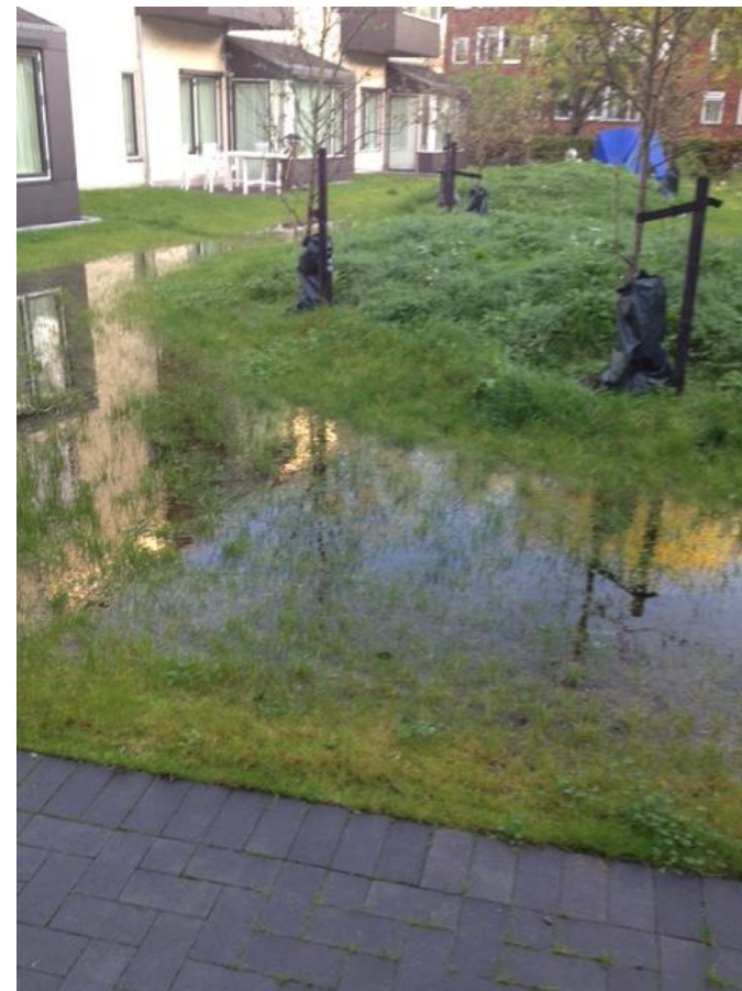
Et eksempel på L.A.R.

I parken genopfører vi vores hønsehus, og glæder os til igen at have løsgående høns. I forbindelse med vores café, som er åben for alle, skal der anlægges en legeplads. Drømmen er, at de unge mødre vil